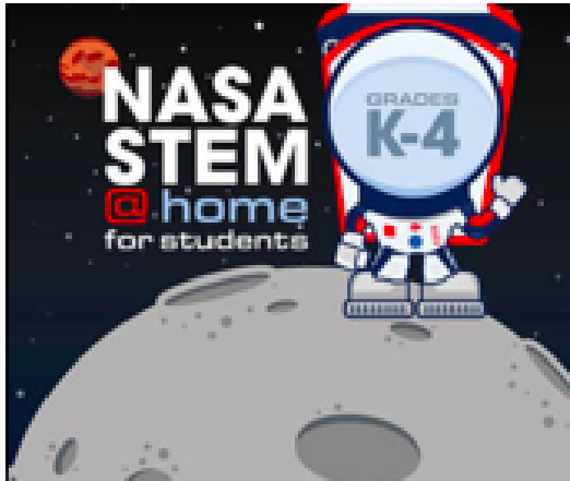
NASA STEAM Home