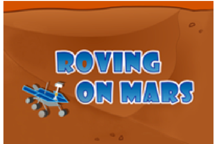
Roving on Mars