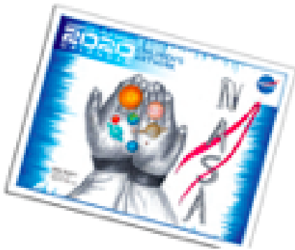
2020 Calendar with Student Artwork