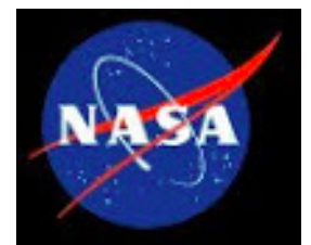
Site da NASA