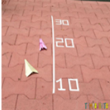
Origami - Video 4