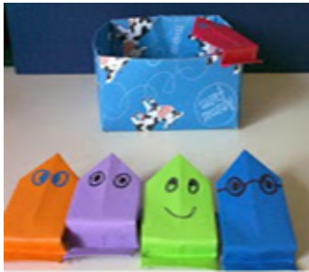
Origami - Video 1