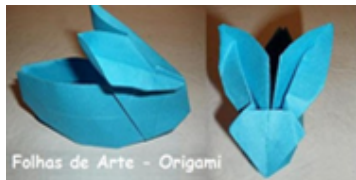
Folhas de Arte - Origami Origami - Video 3

Perante a necessidade de isolamento social devido ao COVID-19, esta é uma forma de, mesmo assim, a criança vivenciar a época da Páscoa, promovendo a orientação temporal.